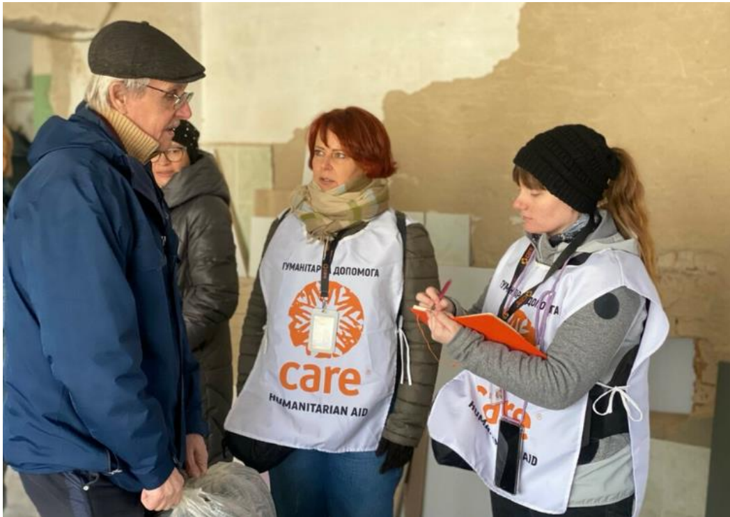
Ukraine : soutien aux populations impactées par la guerre.

Parce que les droits des femmes et des filles sont encore bafoués dans tous les pays du monde, le rôle des organisations féministes est indispensable pour lutter contre les discriminations sexistes. Or, ces associations souffrent d'un manque de moyens financiers et leurs voix ne sont pas entendues. C'est pourquoi CARE France est leader d'un projet novateur de 15 millions d'euros financé par l'AFD. Nous menons une coalition de six organismes pour soutenir financièrement et techniquement plus de 230 associations féministes des pays du Sud.