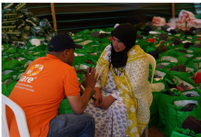
Maroc : soutien aux populations affectées par le tremblement de terre.

Depuis septembre 2022, CARE France, avec Coordination SUD, milite pour une aide humanitaire française plus ambitieuse. Nous avons produit des notes et rencontré les ministères, influençant la nouvelle stratégie humanitaire de la France (2023-2027) dévoilée fin 2023. Celle-ci inclut des avancées majeures comme le doublement des financements d'ici 2025, un accent sur l'approche genre et, pour la première fois, une attention au climat et à l'environnement dans la réponse humanitaire.