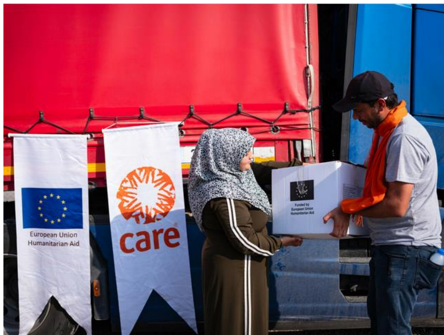
Turquie : distribution de kits d'hygiène aux populations affectées par le séisme.