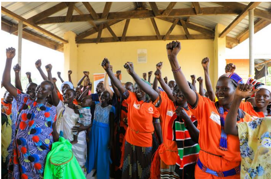
Ouganda : soutien à la santé des femmes.