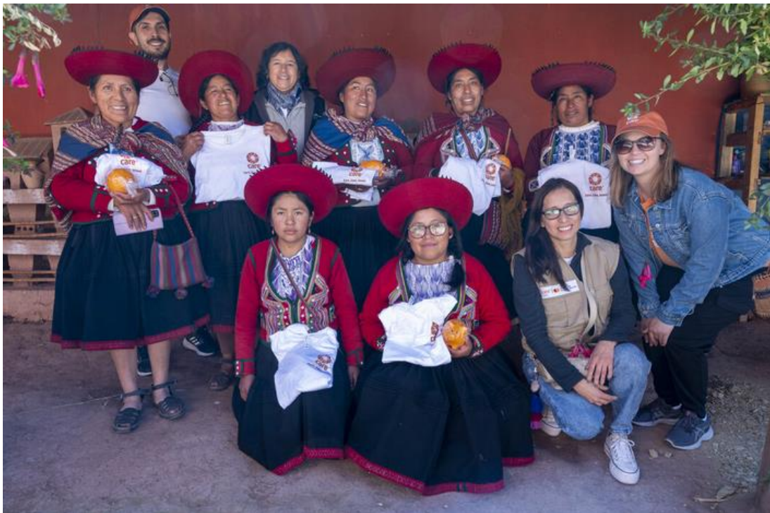
Pérou : soutien à l'autonomisation économique des femmes