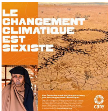
France : Visuel utilisé par CARE France durant la campagne Climate Change is Sexist