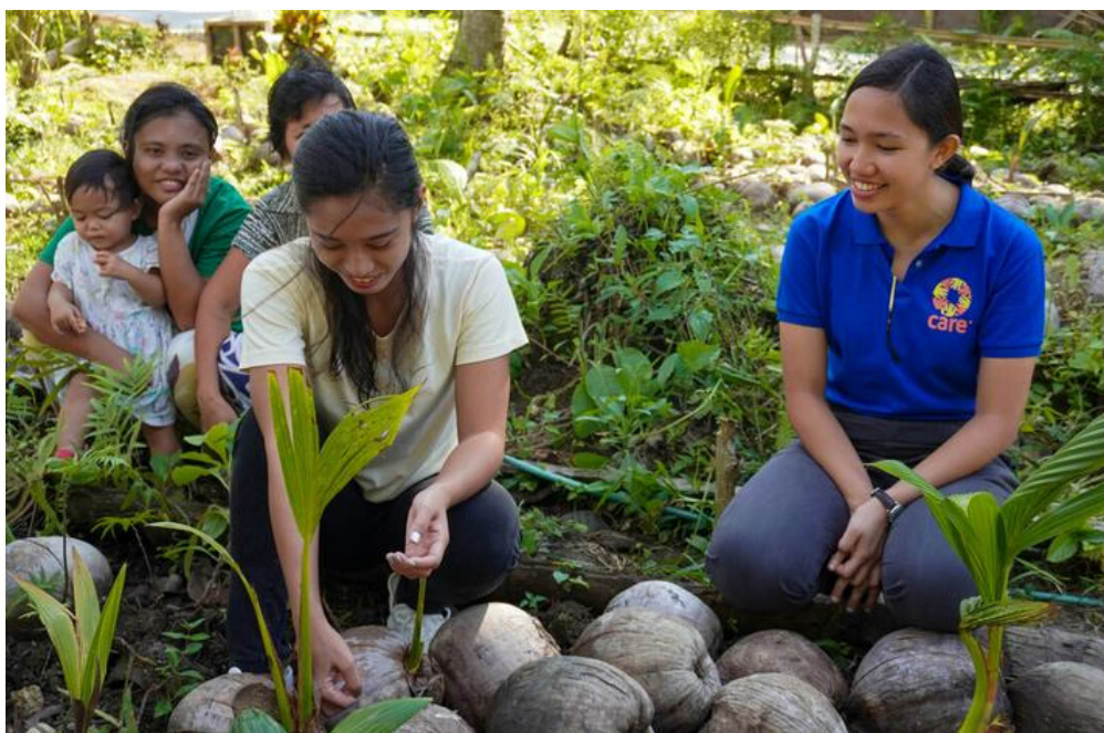
Philippines : soutien à une agriculture durable face aux impacts du changement climatique